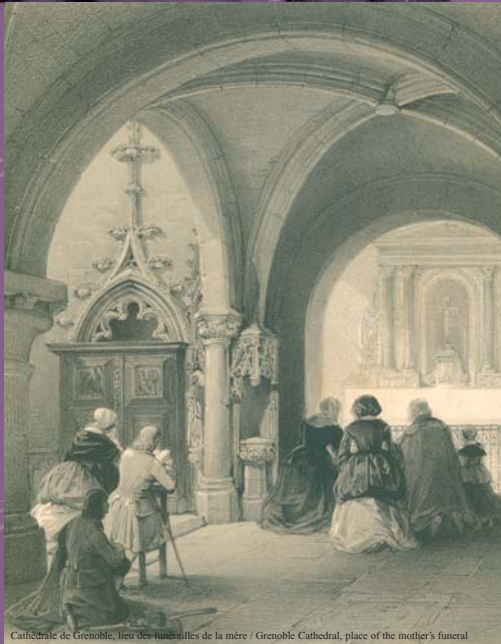
Cathédrale de Grenoble, lieu des funérailles de la mère / Grenoble Cathedral, place of the mother's funeral